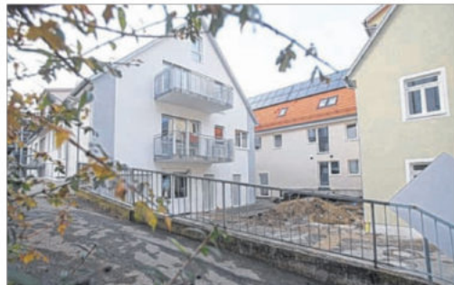
Zentrales Wohnen, mitten im Ortskern: 14 moderne Wohneinheiten wurden in Glems geschaffen.

Weiter hieß es damals: „...es ist das Gebäude der Firma Franz und Co., heute Firma Friedrich Seiz, Arbeitshand-schuh.“ Die Firma Seiz war 1986 in das Gebäude gezogen, hatte auch einen Anbau erstellt, vergrößerte sich dann aber im Jahr 2003 in einen Neubau am Ortseingang. Die beiden Gebäude – also das Schul- und das Lehrerhaus – gingen in den Besitz der Stadt über. Diese errichtete im kleinsten Ortsteil hier einen kleinen Versamm-