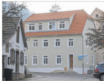
Ortsbildprägendes Ensemble: Das ehemalige Schulhaus ist nun Wohnhaus.

Nachdem feststand, dass gemeinsam mit der Kirchengemeinde an der Eninger Straße ein Dorfgemeinschaftshaus